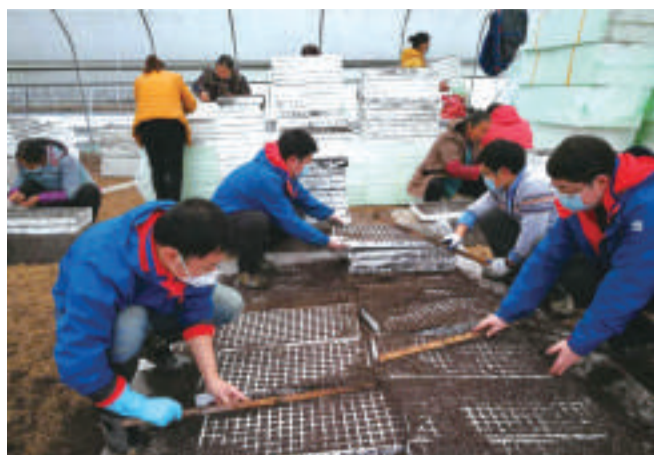
农资集团服务队对当地农户进行现场技术指导