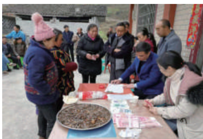
入股合作社的农民拿到年度分红