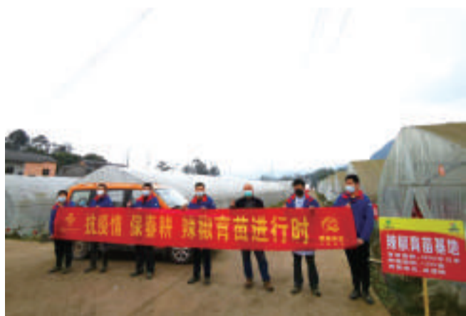
抗疫情保春耕辣椒育苗进行时