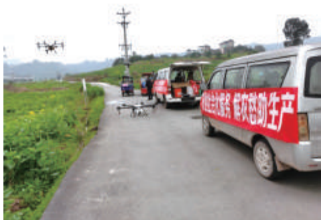
使用无人机进行田间施肥